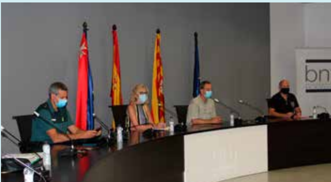
Los miembros de la Junta de Seguridad en la reunión que mantuvieron en el salón de actos de la casa consistorial.