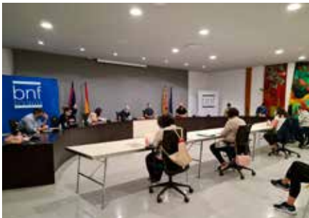
⌚ Sesión plenaria del mes de septiembre.

El pleno municipal de Binéfar aprobó, en su sesión ordinaria de septiembre celebrada el jueves 24, destinar 53.179,50 euros de la partida de festejos populares –no consumidos por la cancelación de los mismos– a la mejora de material e instalaciones de la propia área de Actos Populares y Tradiciones.