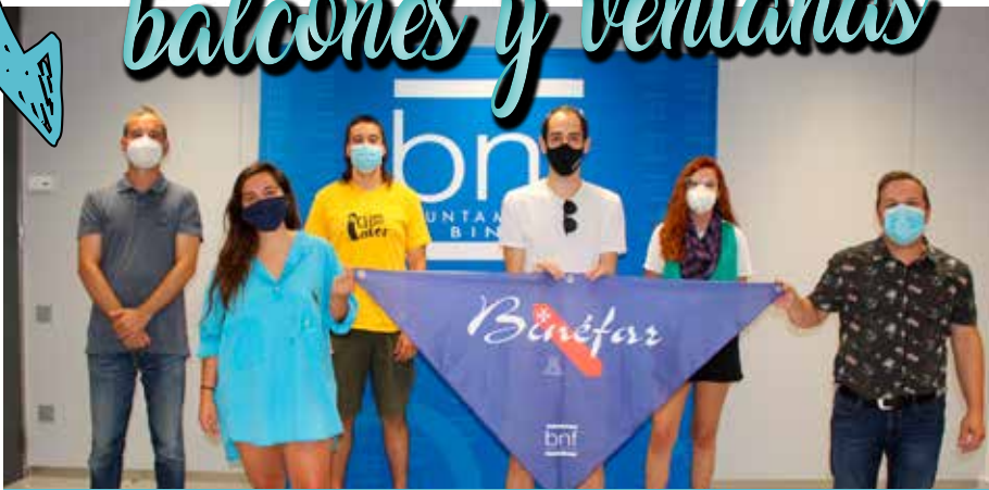
⌚ Ayuntamiento y peñas presentaron la pañoleta de fiestas para balcón.

Los binefarense acogieron con entusiasmo la iniciativa del Ayuntamiento de Binéfar de repartir 1.500 pañoletas de fiestas de gran formato (1,5 metros de longitud) para balcones y ventanas, de modo que los vecinos pudieran colaborar en engalanar la población del 10 al 14 de septiembre, fechas en las que debían celebrarse las fiestas patronales que fueron canceladas.